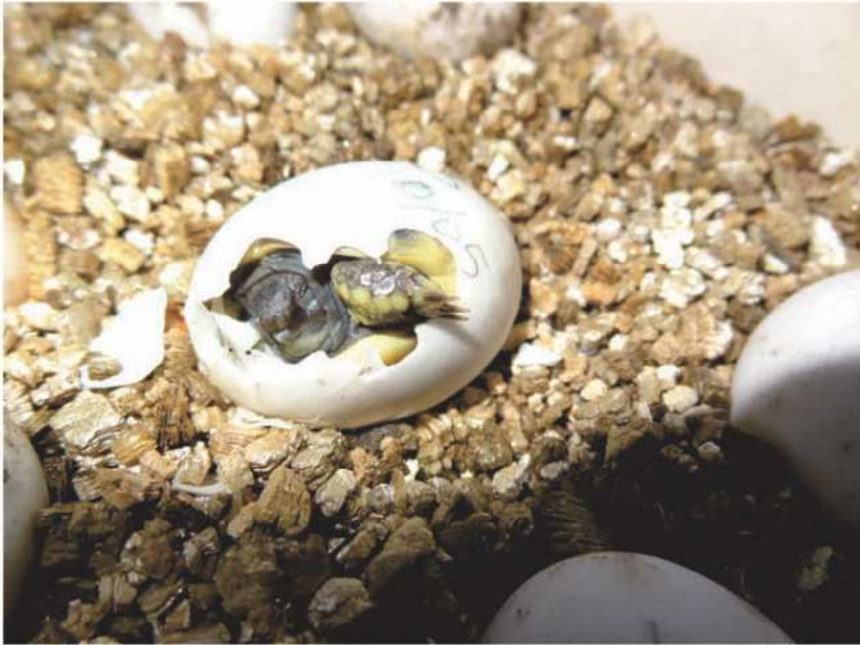
Eclosion d'un œuf de tortue d'Hermann dans un incubateur