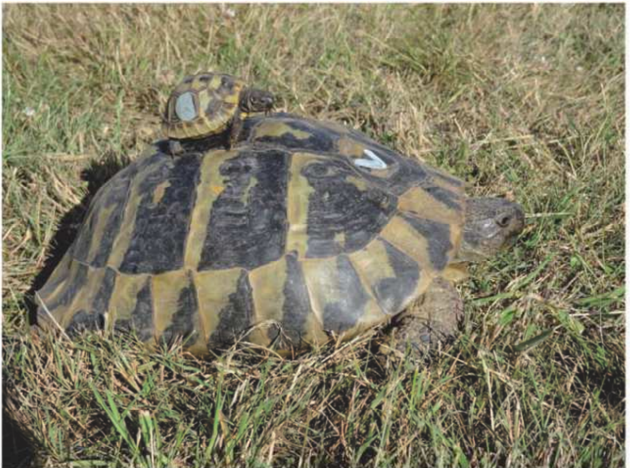
Tortue d'Hermann de 1 an sur une tortue femelle adulte âgée de 50 ans